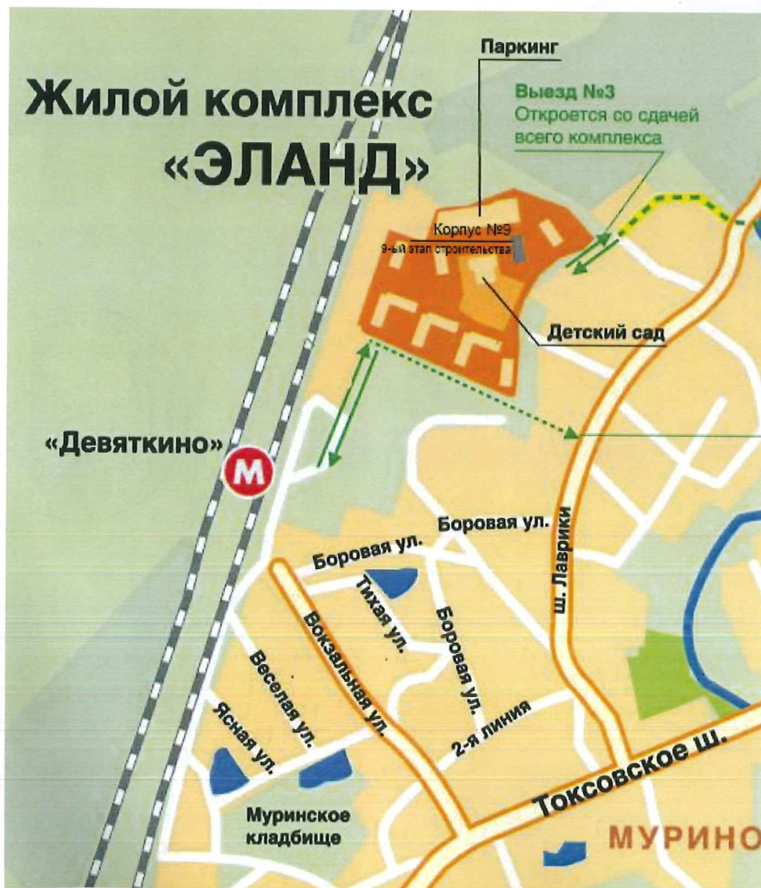
СХЕМА РАЗМЕЩЕНИЯ ОБЪЕКТА

О проекте строительства Многоэтажного жилого дома со встроенными помещениями (9 этап строительства – корпус № 9) по адресу: Ленинградская область, Всеволожский район, земли САОЗТ «Ручьи», уч.2