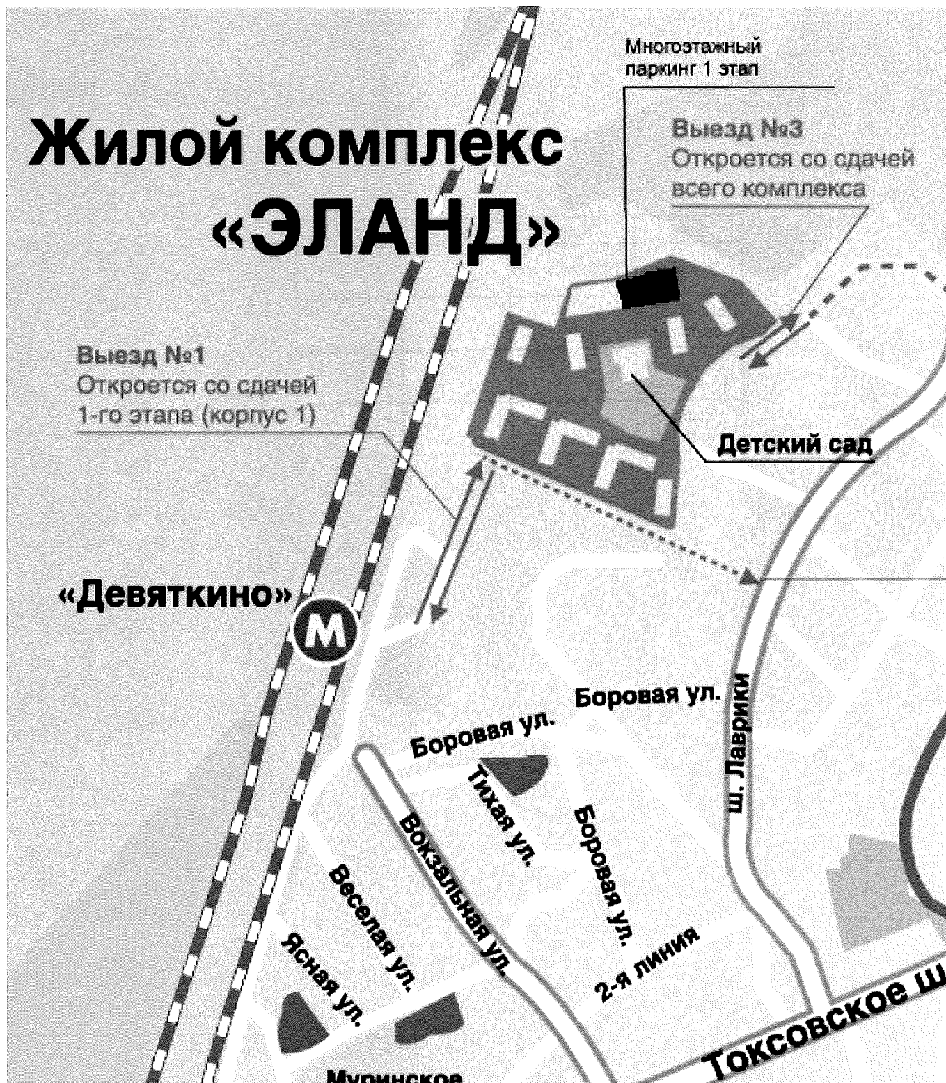
СХЕМА РАЗМЕЩЕНИЯ ОБЪЕКТА