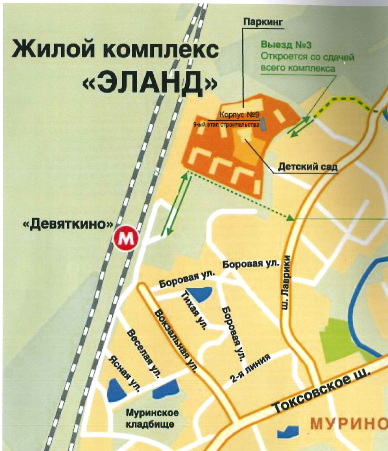
СХЕМА РАЗМЕЩЕНИЯ ОБЪЕКТА

Приложение №2 к Изменению №4 от 31.07.2015 года в Проектную декларацию от 18.02.2015 года О проекте строительства Многоэтажного жилого дома со встроенными помещениями (9-й этап строительства – корпус № 9) по адресу: Ленинградская область, Всеволожский район, земли САОЗТ «Ручьи», уч.2