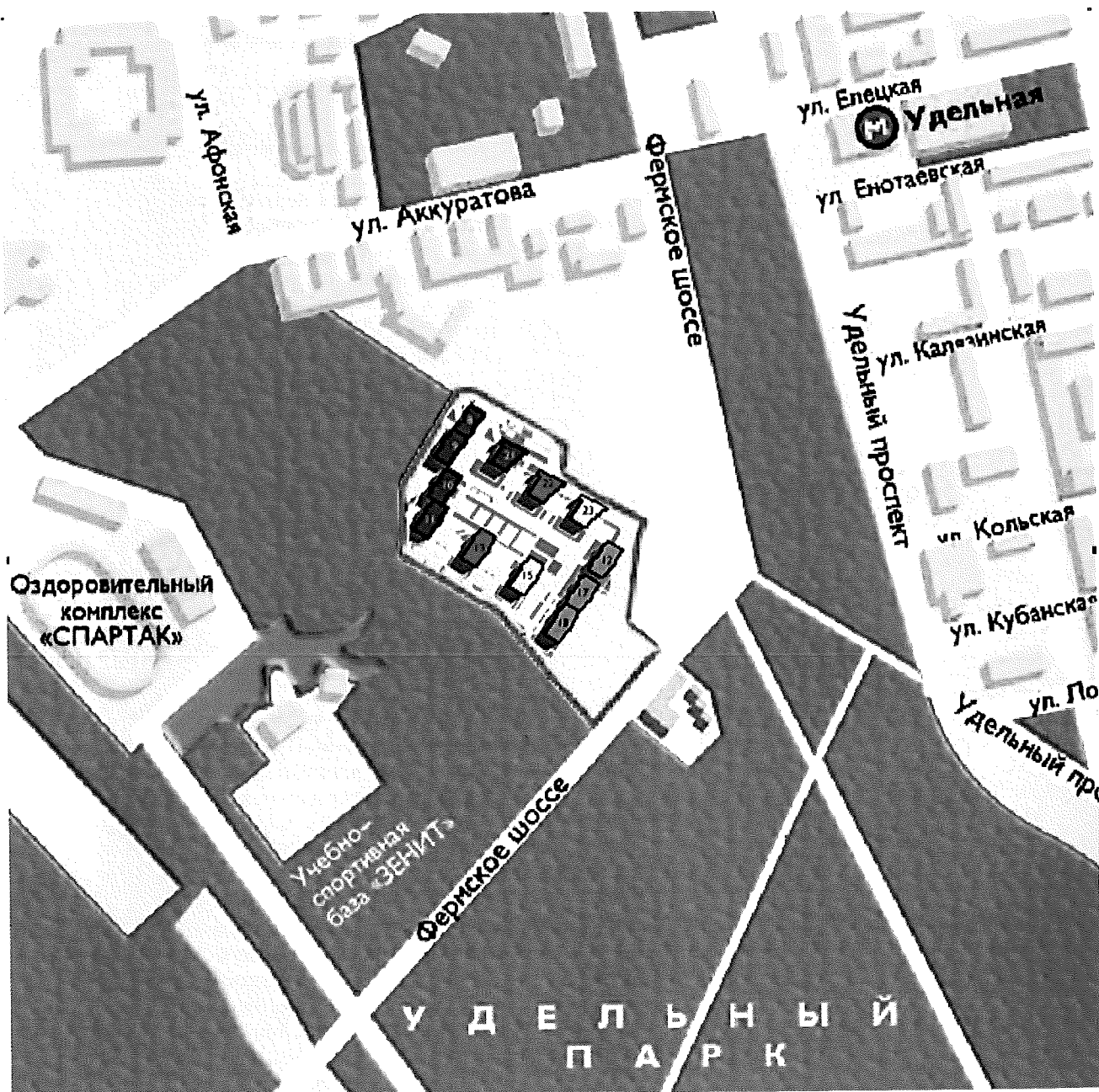
СХЕМА РАЗМЕЩЕНИЯ ОБЪЕКТА

Приложение № 2 к Проектной декларации от 31.07.2014г. О проекте строительства комплекса жилых домов со встроенно – пристроенными помещениями, 1-4 этап строительства, корпуса 8-9, 10-11, 12, 13, 15, 17-18, 21, 22, 23 и пристроенной автостоянки по адресу: г. Санкт-Петербург, Фермское шоссе, д.22, литр В От 07.05.2014г.