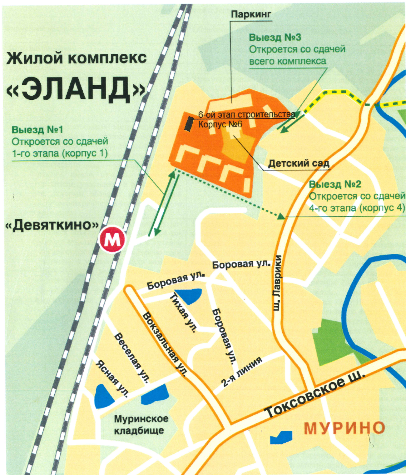
СХЕМА РАЗМЕЩЕНИЯ ОБЪЕКТА